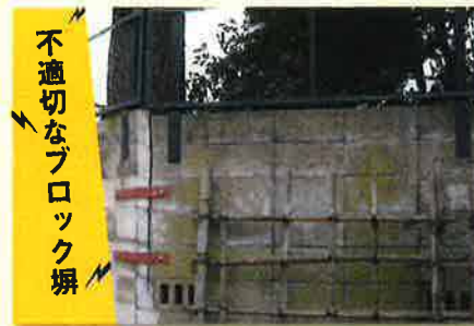
不適切なブロック塀

こんな症状があると、震災時に転倒や倒壊の恐れがあります。人が死傷したり、救急活動・物資供給の妨げになります。専門家に相談の上、早めの対策をしましょう。