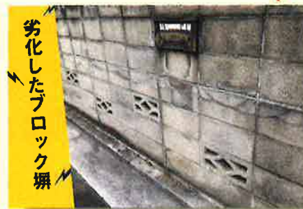
劣化したブロック塀