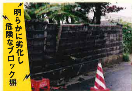
明らかに劣化し 危険なブロック塀