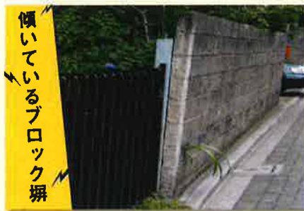
傾いているブロック塀