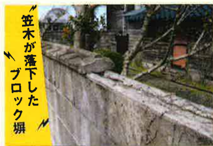
笠木が落下した ブロック塀